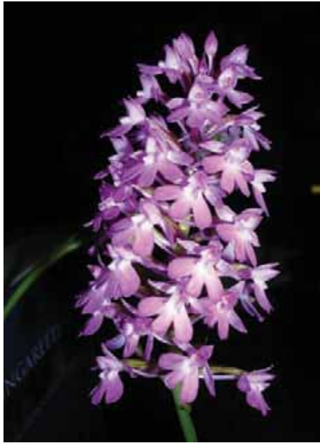
Anacamptis pyramidalis (L.) L.C. Rich

Un tempo molto frequente a Montenars, ora è difficile poterla osservare. E' alta da 10 a 50 cm, ha lo stelo verde chiaro come le foglie. Veniva detta Scarpute de Madone per lo specchio del labello che ricorda la lettera M.