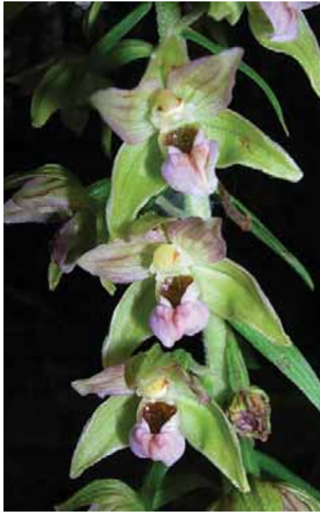
Epipactis Helleborine (L.) Crantz Zona roccoli, Cjampeón È una pianta erbacea perenne alta normalmente da 20 a 60 cm (massimo 100 cm) Profuma di valeriana, può avere sul fusto anche un centinaio di fiori. La riproduzione avviene tramite impollinazione da parte di vari insetti.