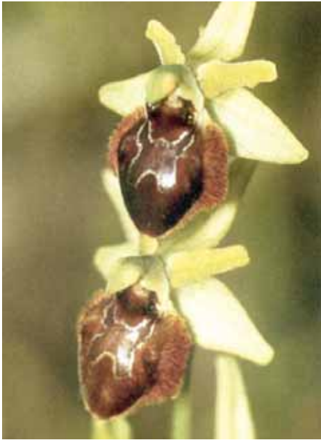
Ophrys sphegoides Miller

Un tempo molto frequente a Montenars, ora è difficile poterla osservare. E' alta da 10 a 50 cm, ha lo stelo verde chiaro come le foglie. Veniva detta Scarpute de Madone per lo specchio del labello che ricorda la lettera M.