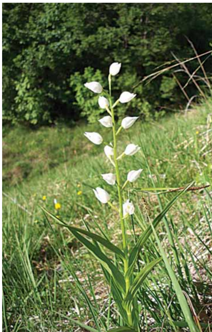
Cephalanthera longifolia (L.) Fritsch

Salita da Artegna, Rivón, verso l'Orvenco.