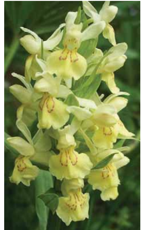
Dactylorhiza sambucina (L.) Soó Cuarnan Profuma di sambuco. Può avere fiori gialli, come questa trovata in Cuarnan vicino all'abbeveratoio, oppure rossi. Altezza: da 10 a 30 cm. I tuberi non sono ovali, ma a forma ramificata.