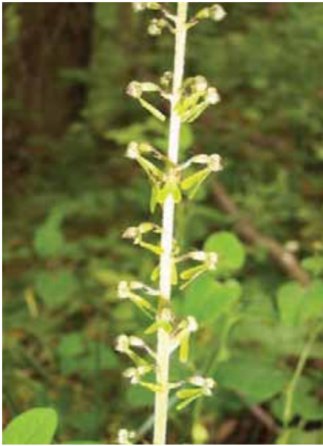
Listera ovata (L.) R. Br. Zona roccoli, Cjampeón Poco appariscente. Ha solo due foglie basali, di forma ovale. L'altezza di questa pianta varia da 40 a 60 cm; è pianta perenne erbacea che porta le gemme in posizione sotterranea. Durante la stagione avversa non presenta organi aerei e le gemme si trovano in organi sotterranei chiamati rizomi dai quali, ogni anno, si dipartono radici e fusti aerei.