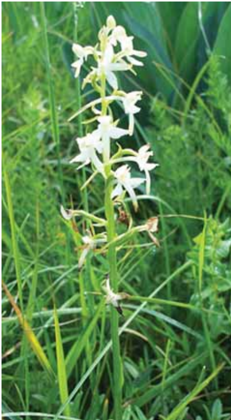
Platanthera bifolia (L.) L.C. Rich Cuarnan. Profuma di giacinto. E' alta da 15 a 40 cm. La parte sotterranea consiste in due bulbi interi, di forma ovale.