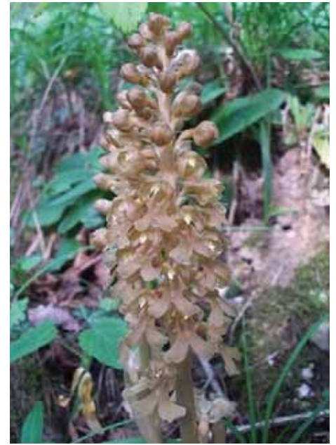
Neottia nidus-avis (L.) L.C. Rich Si trova frequentemente a Montenars, nei boschi. Profuma di miele. E' pianta saprofita priva di clorofilla, utilizza per assumere gli elementi nutritivi un fungo ( Rhizomorpha neottiae ). Deve il suo nome alla forma aggrovigliata dei pseudotuberi, che ricorda un nido d'uccello. La fioritura può essere addirittura sotterranea.