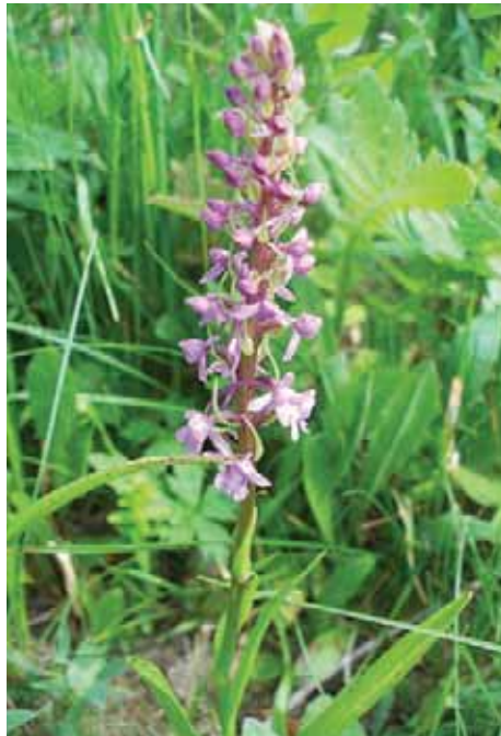
Gymnadenia conopsea (L.) L. C. Rich Cuarnan L'altezza di queste piante varia da 20 a 60 cm (massimo 80 cm). Sono piante perenni erbacee che portano le gemme in posizione sotterranea. Durante la stagione avversa non presentano organi aerei e le gemme si trovano in organi sotterranei chiamati bulbi, organi di riserva che annualmente producono nuovi fusti, foglie e fiori.