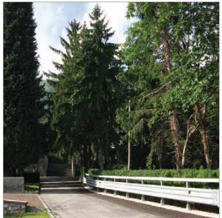
Lavori di consolidamento presso il cimitero di S.Elena