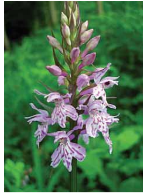
Dactylorhiza maculata (L.) Soò

Roccoli e molti altri luoghi. Dai tuberi si ricavava una specie di fecola detta saleb (nome arabo) usata in erboristeria.