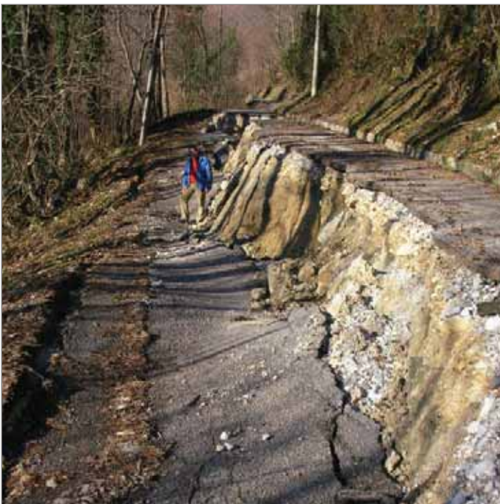
Sottocretto: la frana

Sono stati effettuati lavori di consolidamento del ciglio stradale di fronte al cimitero di S. Elena e in località Isola, con l'applicazione di barriere di protezione.