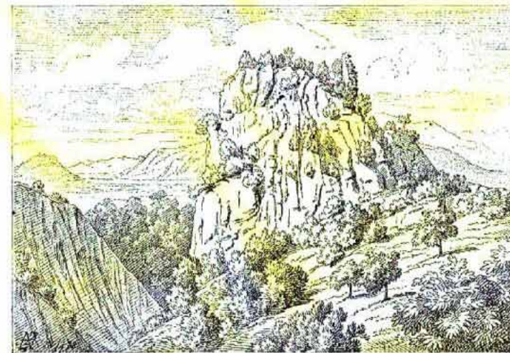
Nach der Natur v. Zalus