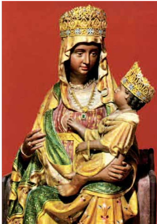
La Madonna di Castelmonte

Anche il diavolo spiccò il volo e salì velocemente ma, all'atterraggio, trovò la Ma-