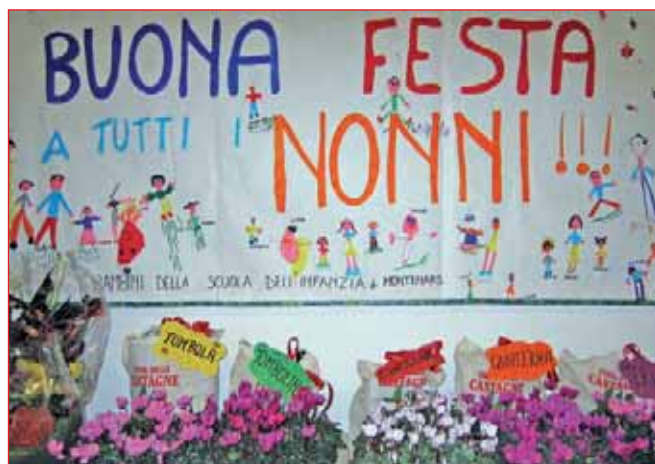
Cartellone preparato dai bambini dell'asilo per i nonni

Sono state premiate tre torte dove la giuria ha fatto non poca fatica a scegliere la più