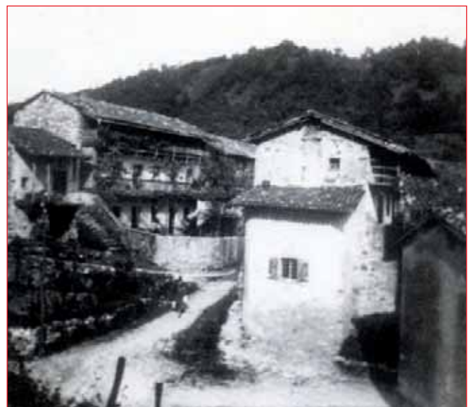
Scorcio della borgata di Isola - anni 50