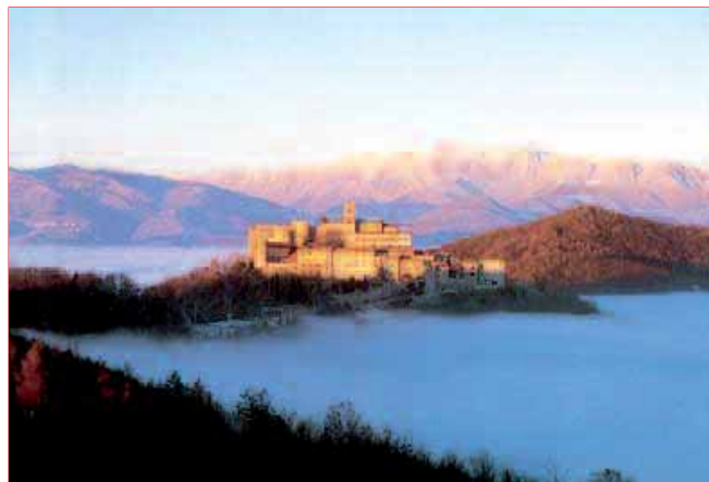
Il Santuario di Castelmonte