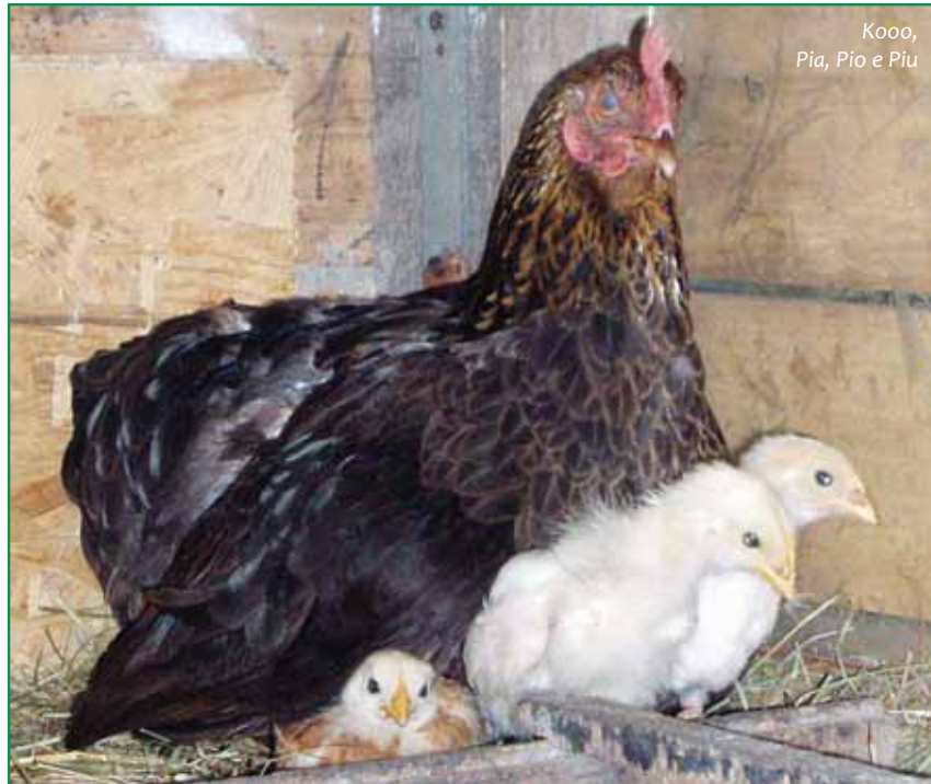
Kooo, Pia, Pio e Piu